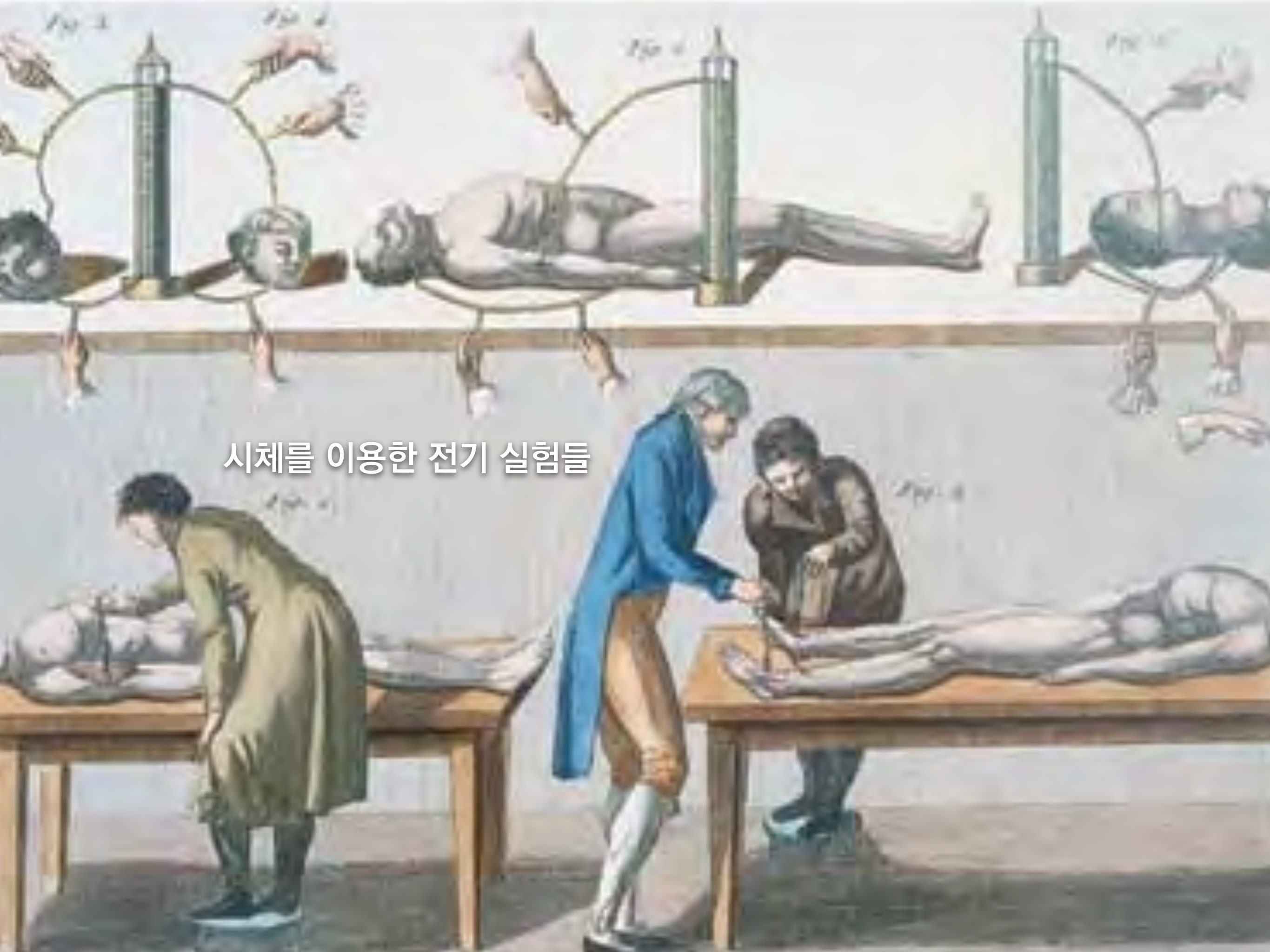
시체를 이용한 전기 실험들